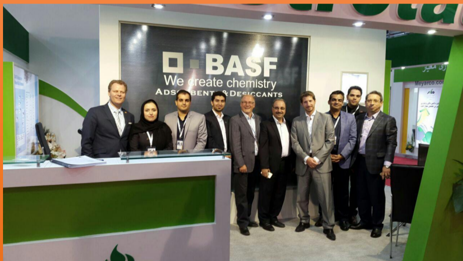
غرفه مشترک شرکت پتروتات و BASF در نمایشگاه نفت ۹۶ زمان: ۱۶ الی ۱۹ اردیبهشت ۱۳۹۶