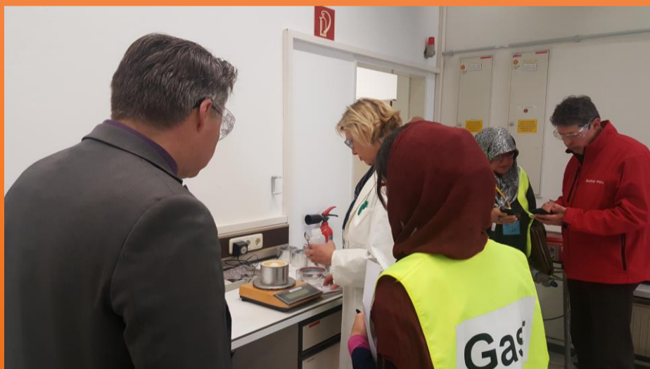
بازدید شرکت پتروشیمی پلیمر کرمانشاه از خط تولید Sorbead شرکت BASF زمان: ۱۶ الی ۱۹ اردیبهشت ۱۳۹۶